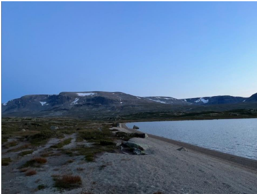
Flott ved Halletjødn.

Oppsummert er det en reduksjon av besøkende på alle turene med unntak av Ruudtoppen.